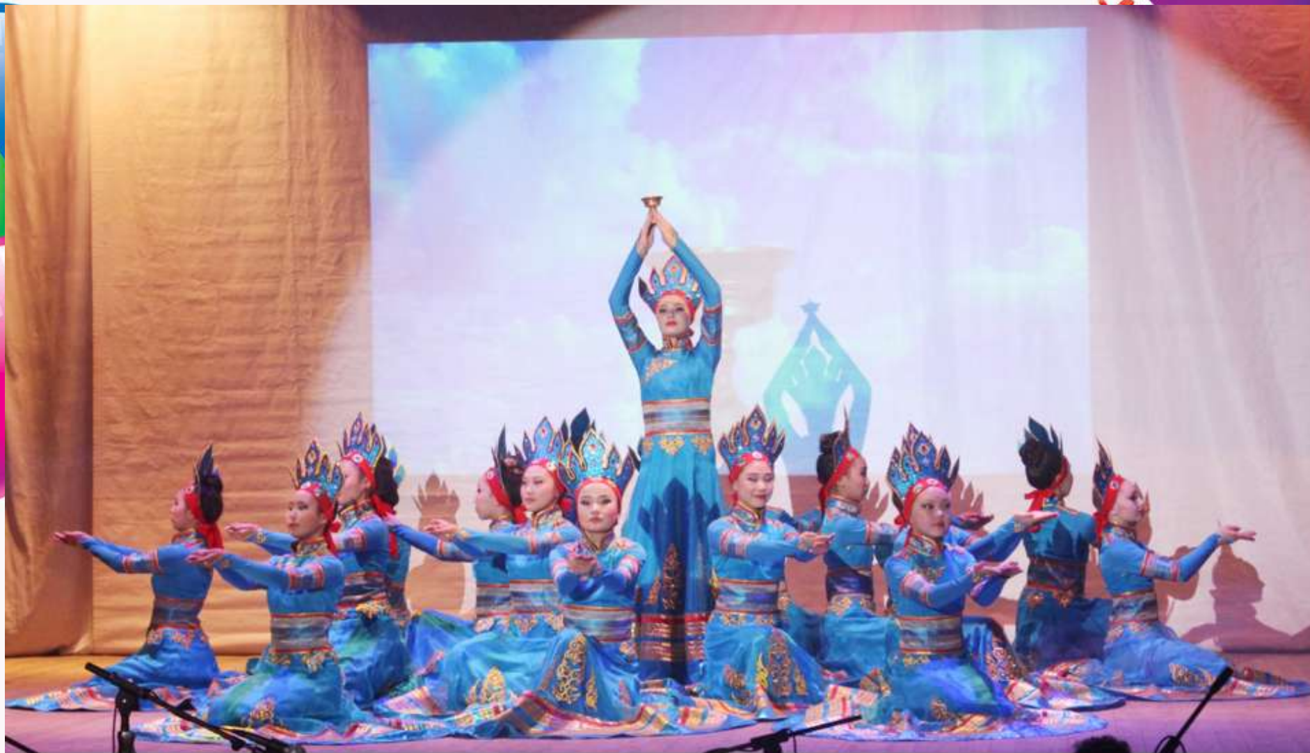
Специальный приз танец «Зула»